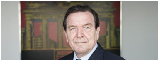
Gerhard Schröder